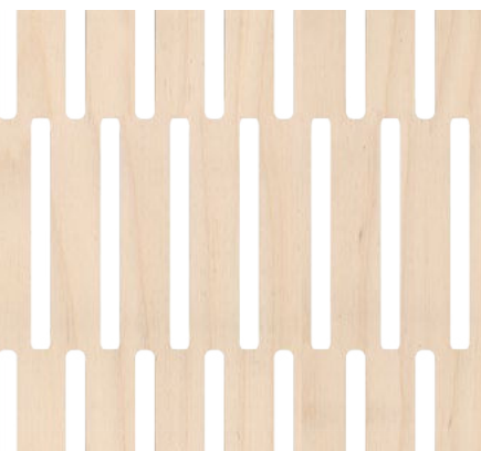
back side: 4/4 mm, plywood birch