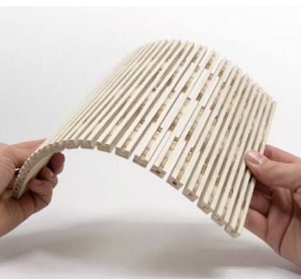
4/4 mm, plywood birch 10 mm